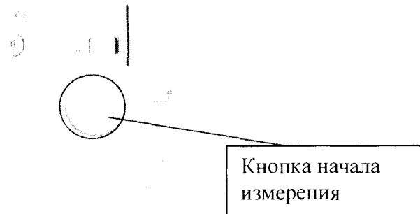
Рисунок 4 – Джойстик управления измерениями

8.3.4 Произвести точную наводку на меру с помощью джойстика (рисунок 4). Вывести изображение глаза на монитор и сфокусироваться, используя джойстик, при этом появится луч центрировки. Переместить метку перекрестия в центр меры. При этом появится индикатор фокусировки (красный прямоугольник). Переместить луч фокусировки в центр метки перекрестия и сфокусироваться в соответствии со стрелками индикатора фокусировки, с помощью джойстика. При получении фокуса индикатор становится зеленым. Нажать на джойстике кнопку начала измерения (рисунок 4).