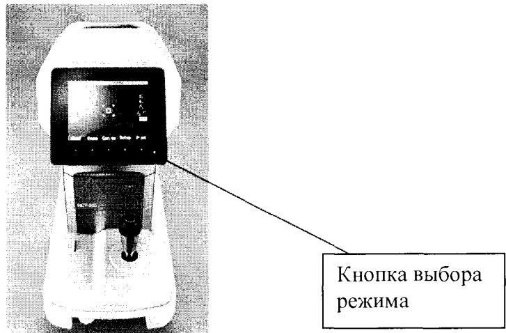
Рисунок 3 – Выход в окно Setup измерений на тонометре

8.3.4 Произвести точную наводку на меру с помощью джойстика (рисунок 4). Вывести изображение глаза на монитор и сфокусироваться, используя джойстик, при этом появится луч центрировки. Переместить метку перекрестия в центр меры. При этом появится индикатор фокусировки (красный прямоугольник). Переместить луч фокусировки в центр метки перекрестия и сфокусироваться в соответствии со стрелками индикатора фокусировки, с помощью джойстика. При получении фокуса индикатор становится зеленым. Нажать на джойстике кнопку начала измерения (рисунок 4).